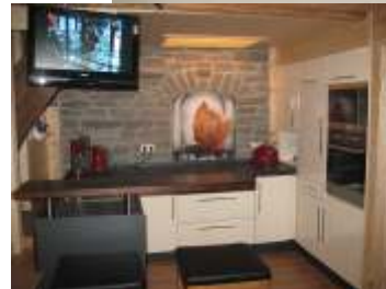
... und exklusiver Einbauküche mit Bartresen.